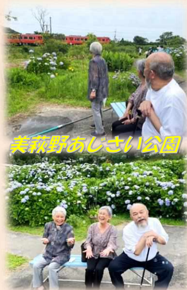
美萩野あじさい公園